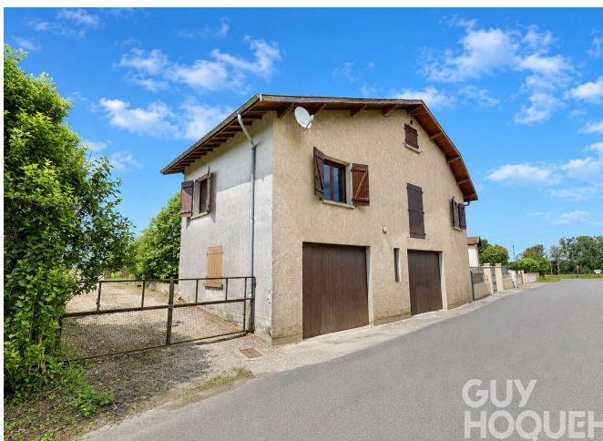
Photo du bien