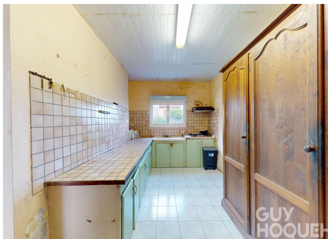
Photo du bien