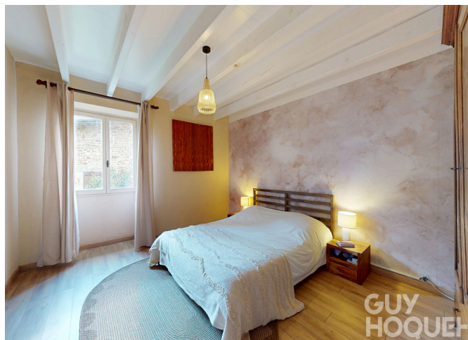
Photo du bien