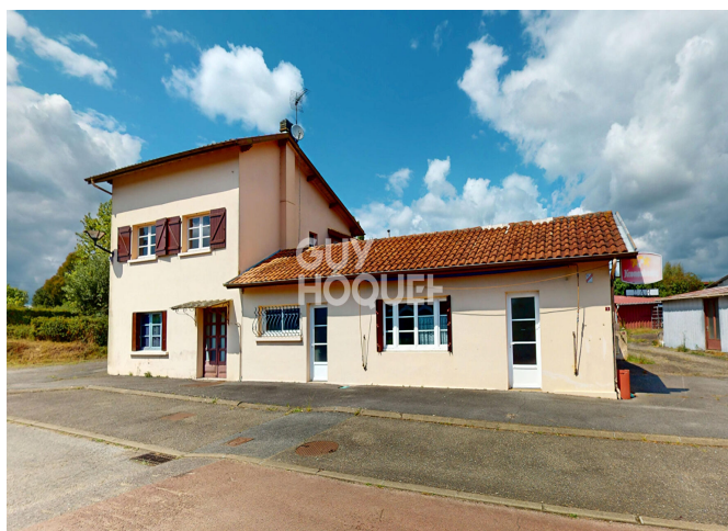
Photo du bien